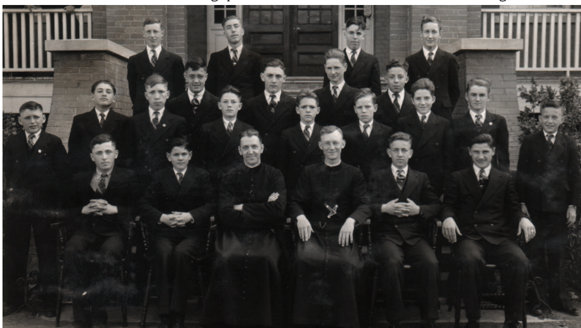
Classe de latin au Juniorat Saint-Jean lors de l'année scolaire 1938-1939.