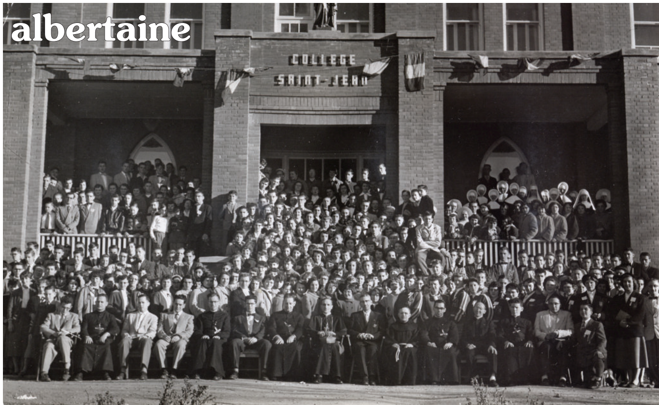
Plus de 300 personnes participent au 1 er congrès de la Relève albertaine, en 1954.

La devise officielle de la relève est « Soyons nous-même ».