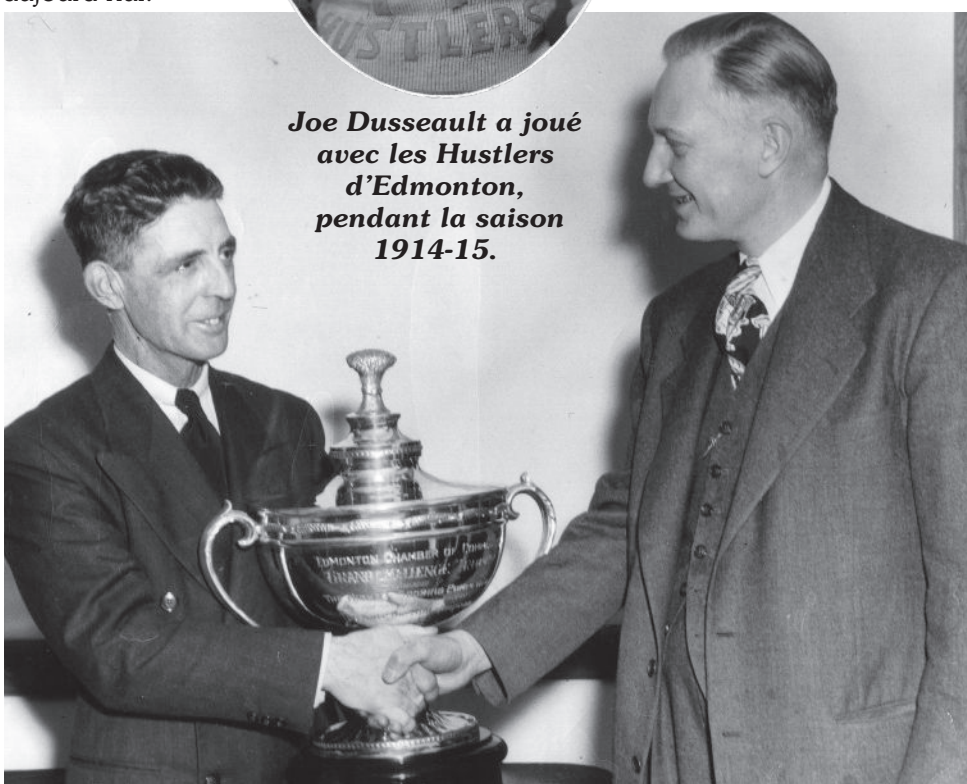
En 1947, il gagna le concours Save the Soil , parrainé par la Chambre de commerce d'Edmonton et le département d'agriculture.